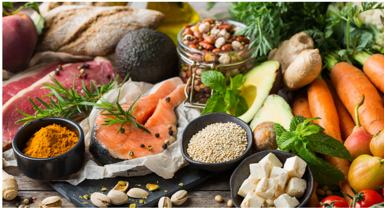
Verbraucherinnen und Verbraucher setzen auf Wahlfreiheit in einem breiten Lebensmittelangebot.

Eine vom Bundesverband des Deutschen Lebensmittelhandels e.V. (BVLH) beauftragte repräsentative ForSA-Verbraucherumfrage zum Thema tierische und pflanzliche Erzeugnisse zeigt: Verbraucherinnen und Verbraucher wünschen sich Wahlfreiheit und einen moderaten Wandel anstelle einer ideologisch aufgeladenen Debatte.